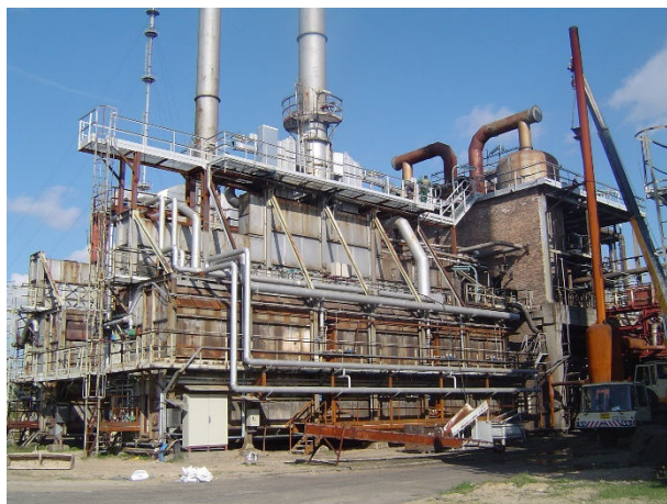
Rys. 1 Piec do syntezy CS 2 po modernizacji