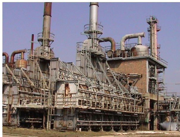
Rys. 2 Piec do syntezy CS 2 przed modernizacją