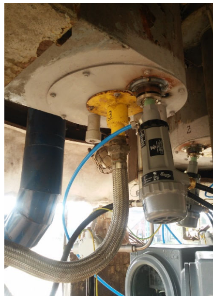
System dozoru płomienia