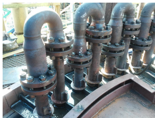
Returbenty górne wymiennika radiacyjnego