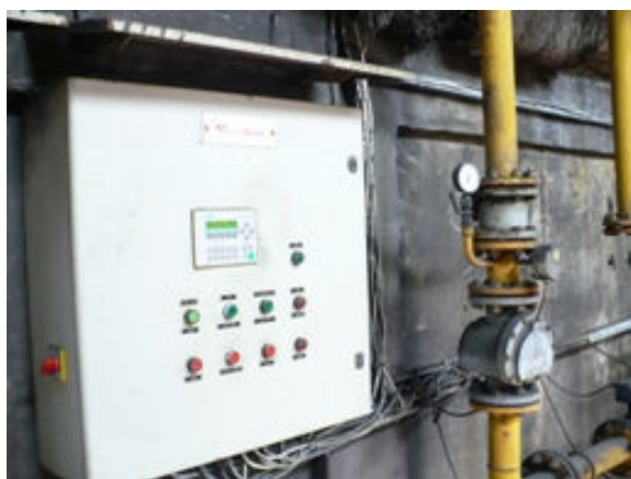
Fot. 4 Szafa sterownicza palnika