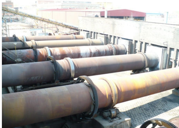
Fot. 1 Widok ogólny pieców obrotowych

Celem modernizacji była zmiana paliwa z węgla na gaz ziemny GZ-50 oraz uzyskanie efektów poprzez zastosowanie dynamicznego palnika gazowego o mocy 7 MW, z możliwością regulacji szerokości i długości płomienia, oraz zautomatyzowanie procesu zapalania, regulacji mocy i kontroli parametrów roboczych palnika.