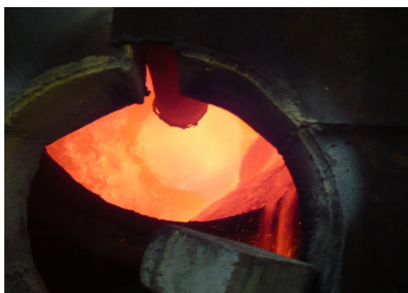
Fot. 5 Palnik w czasie pracy