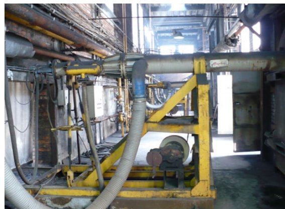
Fot. 3 Układ jezdny palnika 7 MW

Zaprojektowano całkowicie nowe instalacje technologiczne wraz z kompletną armaturą gazową oraz powietrza spalania.