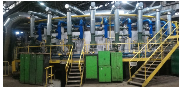
Rys. 5. System grzewczy pieca z obrotowym trzonem o średnicy podziałowej 13,6 m po modernizacji w 2019r.