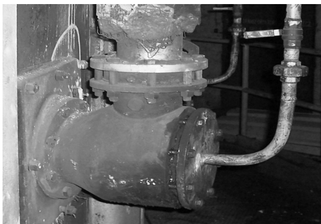
Rys. 1. Palnik wirowy w ścianie pieca z obrotowym trzonem o średnicy podziałowej 6, 5 m