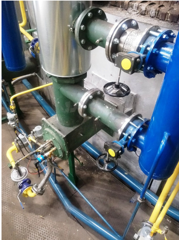
Rys. 3. Palnik rekuperacyjny RPG-600 pieca z obrotowym trzonem o średnicy podziałowej 13,6 m po modernizacji w 2019r.

W 2019 r. PTC PIECOSERWIS przeprowadził modernizację pieca z obrotowym trzonem z zastosowaniem palników rekuperacyjnych projektu PIECOSERWIS uzyskując dalszą obniżkę zużycia gazu.