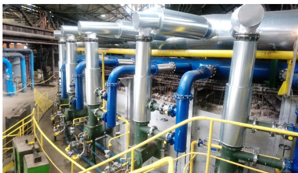
Rys. 4. System grzewczy pieca z obrotowym trzonem o średnicy podziałowej 13,6 m po modernizacji w 2019r.

Od 2019r. nieprzerwanie, skutecznie i bezusterkowo pracuje 10 palników rekuperacyjnych RPG-600 o mocy 600 kW w strefie I pieca obrotowego.