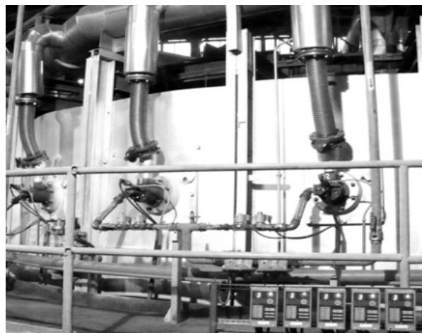
Rys. 2. System grzewczy pieca z obrotowym trzonem o średnicy podziałowej 6, 5 m po modernizacji w 2005r.

Koniecznością staje się więc modernizacja systemów grzewczych budowanych kilkadziesiąt lat temu pieców, zwykle wyposażonych w palniki wirowe. Również wymagania dotyczące: warunków bezpiecznej pracy urządzeń opalanych gazem, emisji zanieczyszczeń do atmosfery przemawiają za tym by intensyfikować wysiłki w celu modernizacji przestarzałych konstrukcji pieców oraz systemów sterowania. Takie modernizacje można wykonać przy niezbyt dużych nakładach finansowych i stosunkowo krótkim czasie stosując nowe konstrukcje palników szybkiego wypływu spalin oraz sterownik programowalny PLC do sterowania piecem i technologią nagrzewania wsadu.